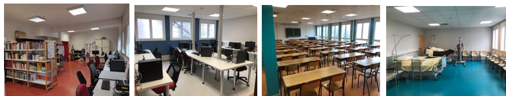
Centre de documentation